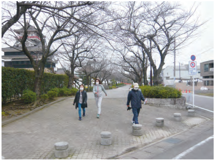
清洲城を後に桜並木を歩く