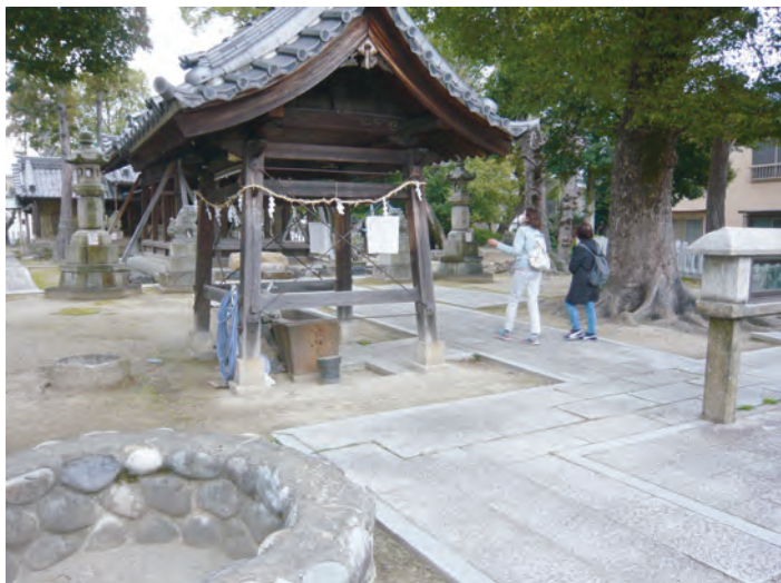
河原神社の井戸跡