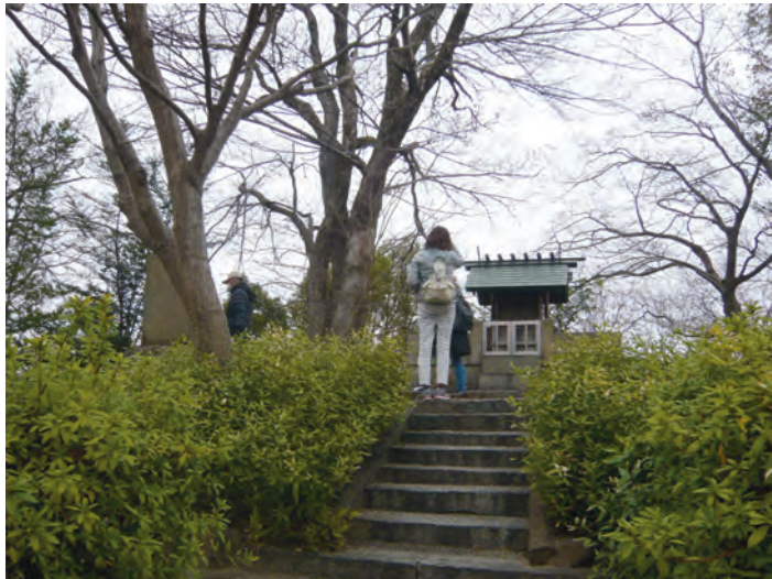
清洲城趾で何を思う