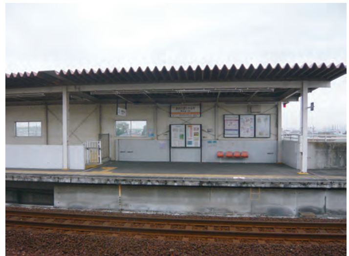
城北線「尾張星の宮」駅