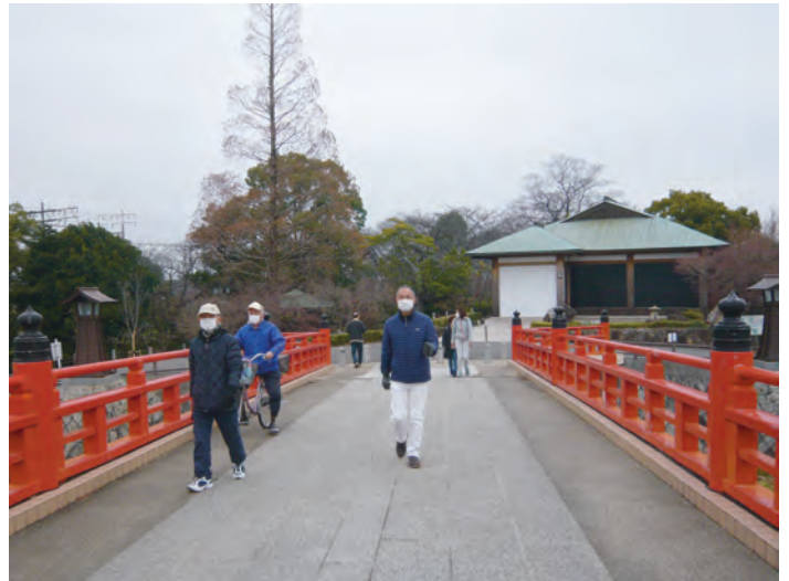
五条川の橋の下にはコイか？